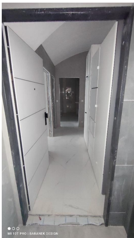
FOTO 27 – Prostor chodby v 1.pp se vstupy do jednotlivých ubytovacích jednotek