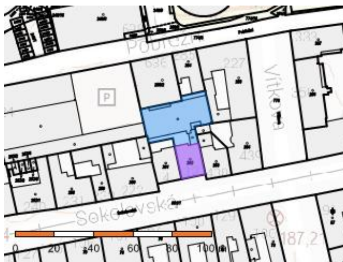
Výřez z katastrální mapy - Karlín