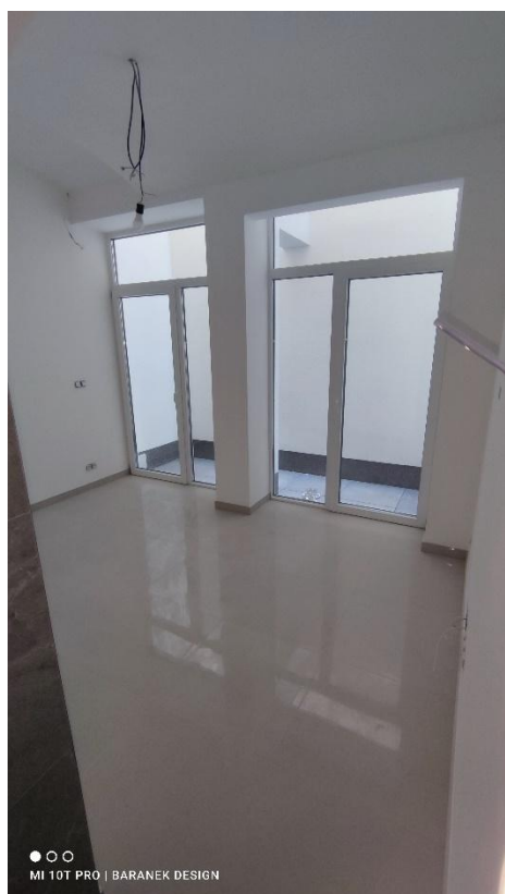
FOTO 13 – Místnost (1.24) v 1.PP s dvojitým průhledem do velkého světlíku