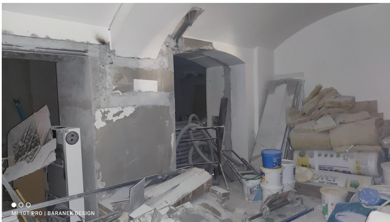
FOTO 17 – Stavebně nedokončený prostor vpravo, (1.28 – 1.46) bez denního osvětlení