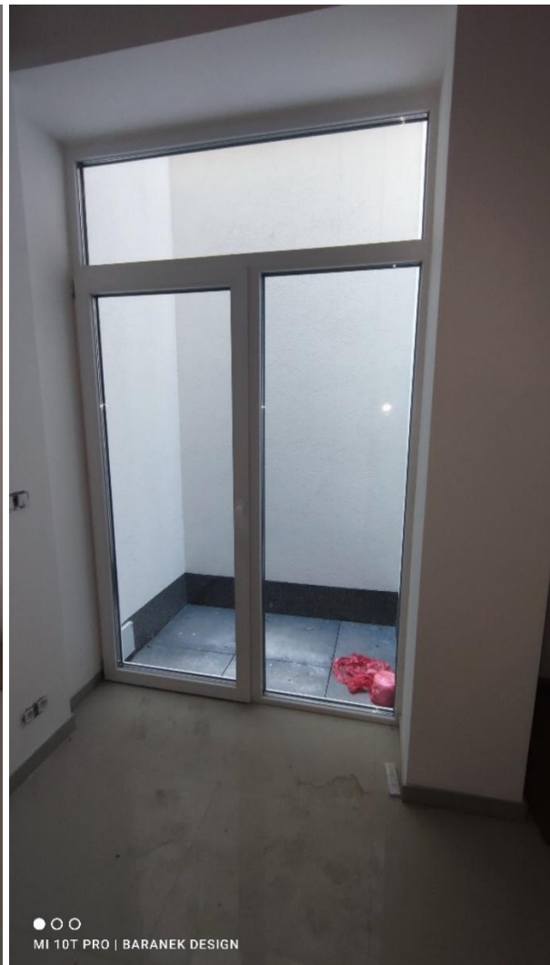
FOTO 11, 12 – Místnost (1.27) v 1.PP s průhledem do malého světlíku