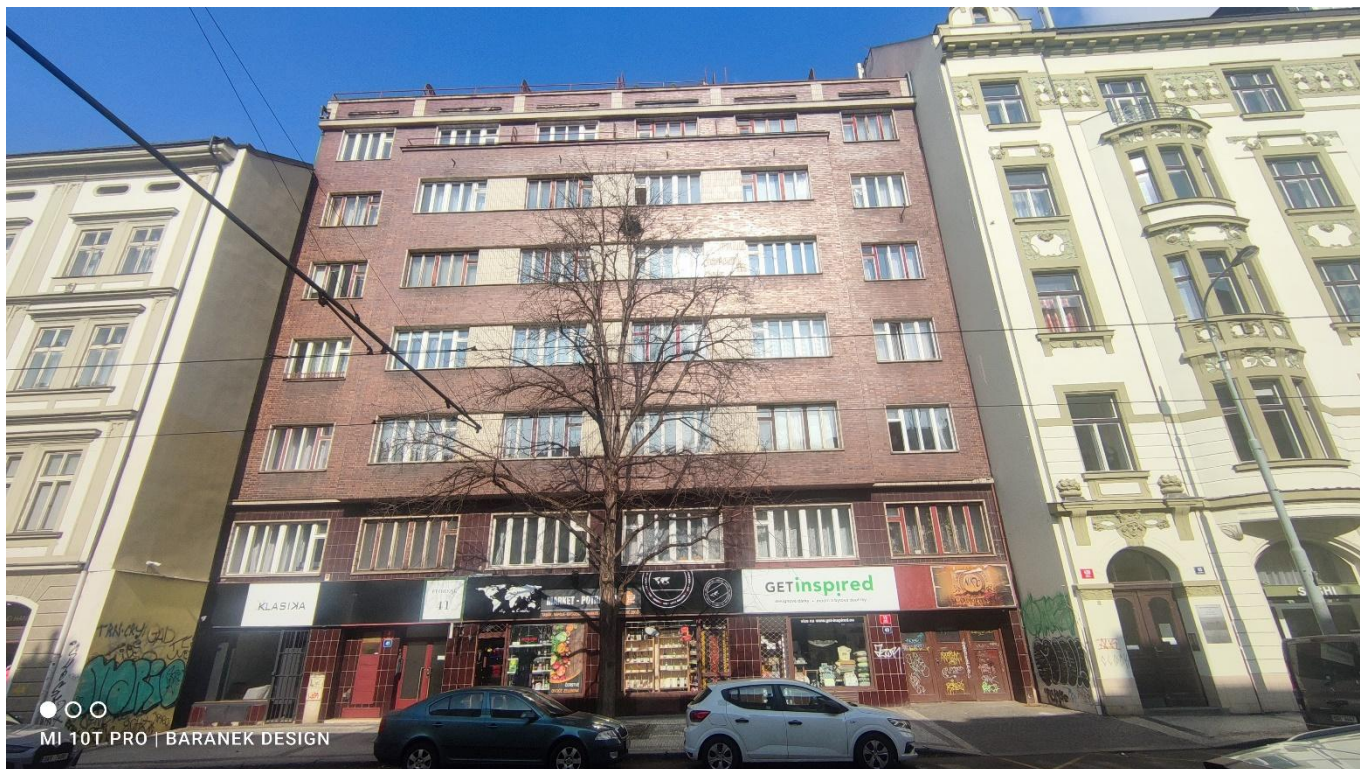
FOTO 01 - Pohled na bytový dům č.p. 12/43, v Sokolovské ulici, v Karlíně (pravá polovina domu)