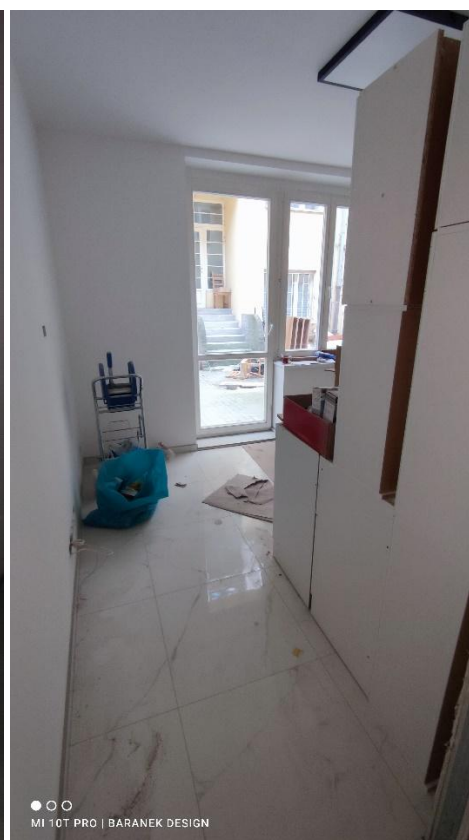
FOTO 18, 19 – Prostory jednotlivých bytovacích jednotek s okny do dvora