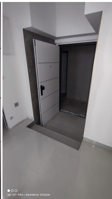
FOTO 24, 25 – Prostory jednotlivých ubytovacích jednotek s okny do dvora