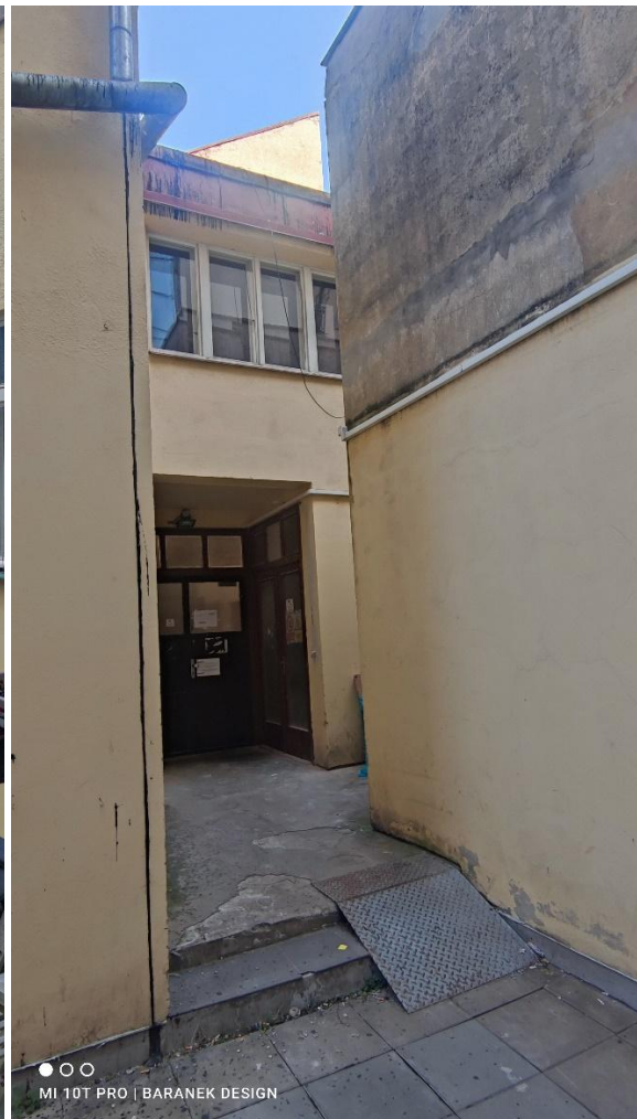
FOTO 03 – Pohled na dvorní část FOTO 04 – Vstup do dvorní části objektu 1.NP