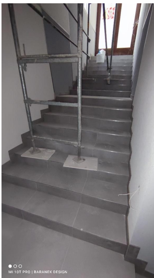
FOTO 05 – Vstupní dveře ke schodišti s přístupem do 1.PP FOTO 06 – Schodiště s přístupem do 1.PP